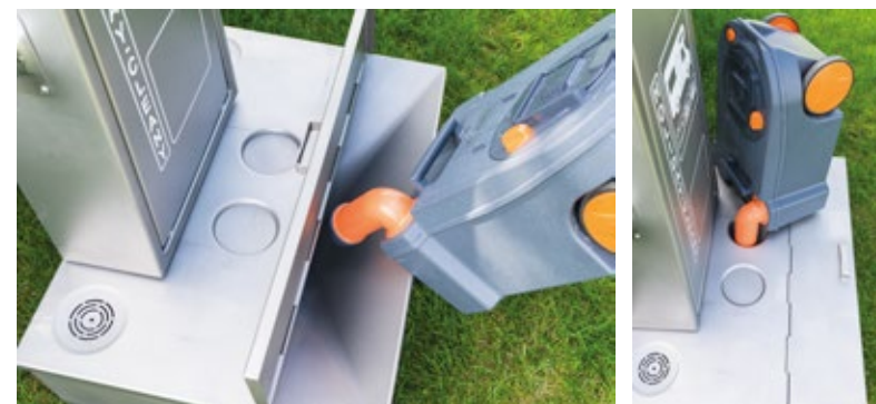
PODSTAWA SERWISOWA USUWANIE NIECZYSTOŚCI PŁYNNYCH Z KASETY WC